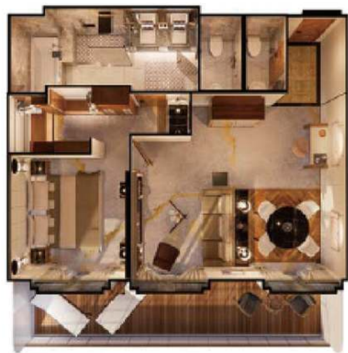
2023年ジュニア・クリスタル・ペントハウス・スイート