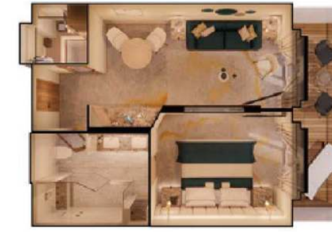
2023年サファイア・ベランダ・スイート