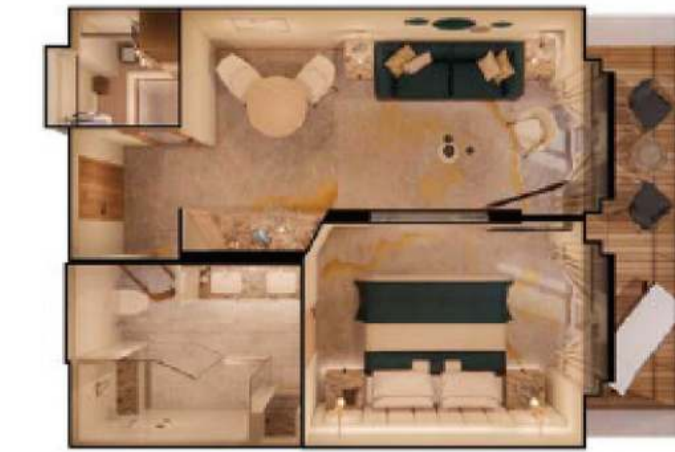
2023年サファイア・ベランダ・スイート