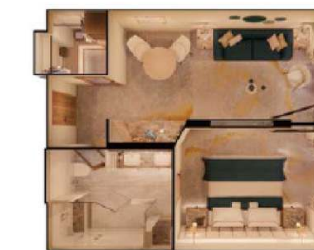
2023年サファイア・オーシャンビュー・スイート