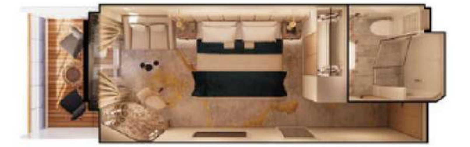
2023年ダブル・ゲストルーム・ベランダ