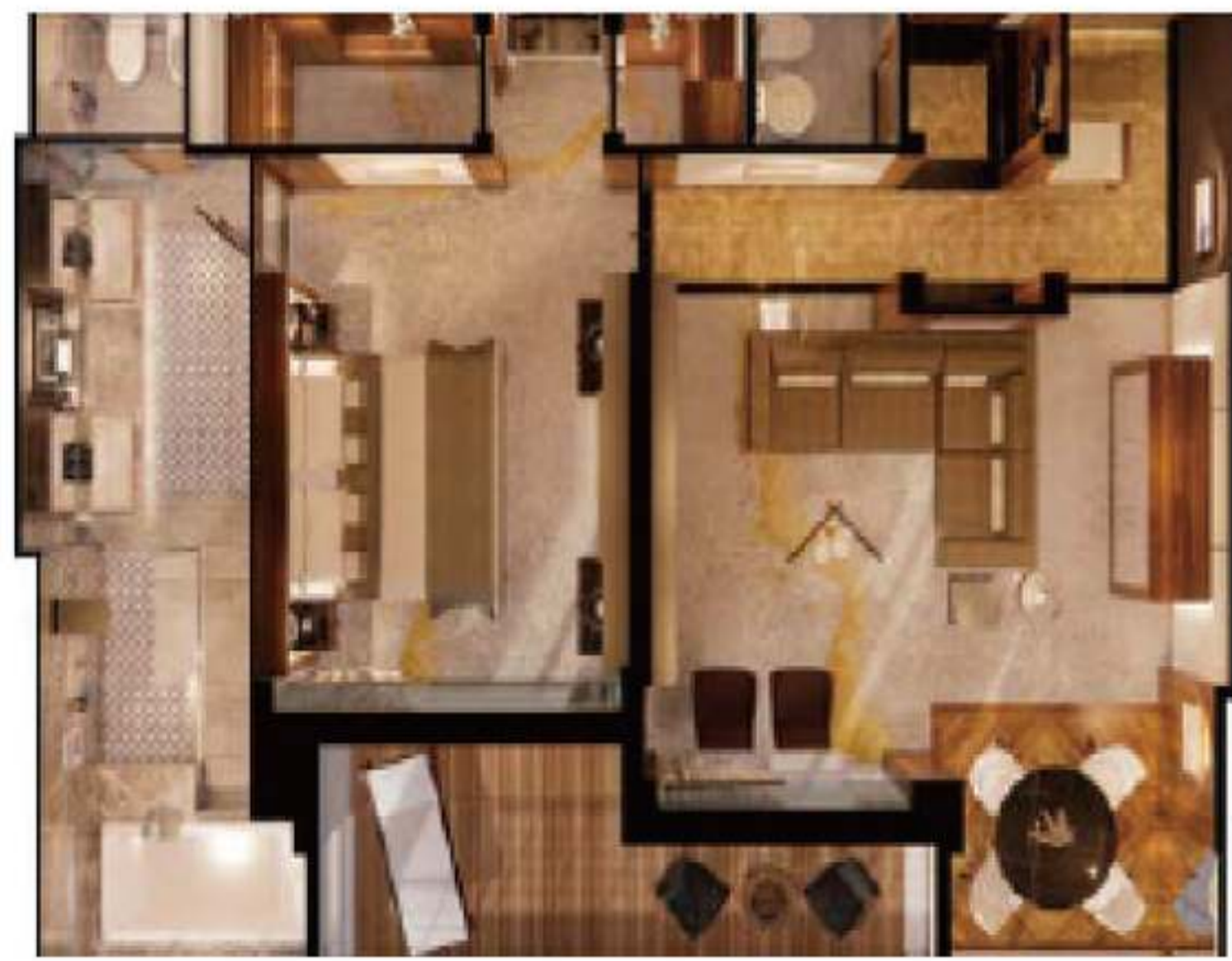
2023年クリスタル・ペントハウス・スイート