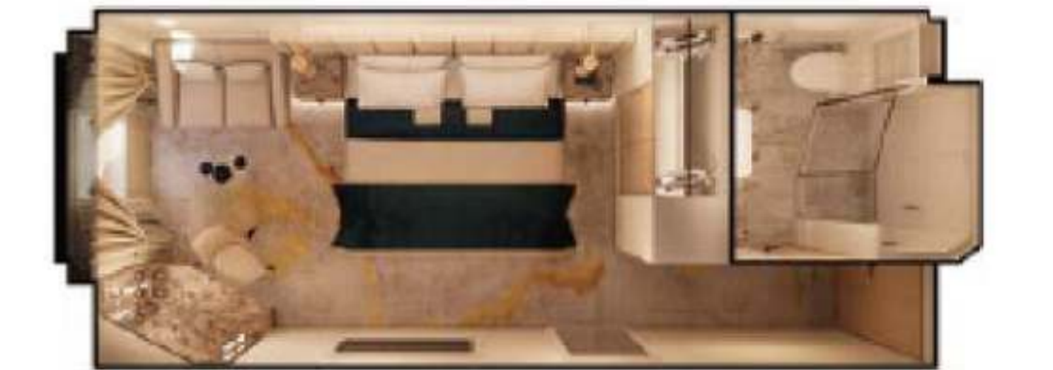
2023年ダブル・ゲストルーム・オーシャンビュー、シングル・ゲストルーム・オーシャンビュー