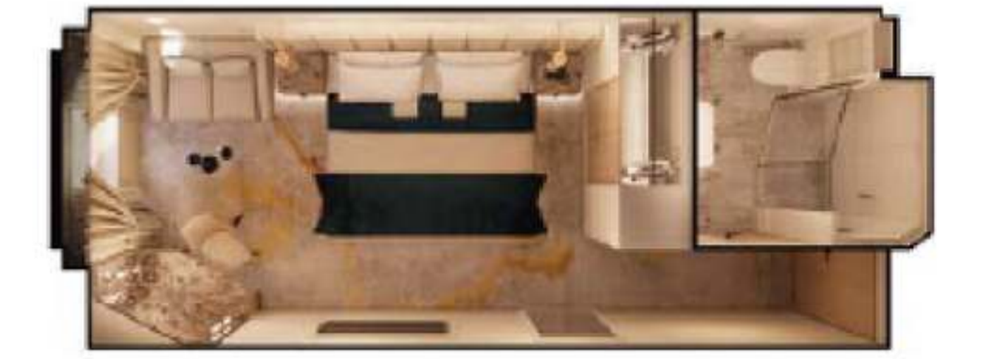
2023年ダブル・ゲストルーム・オーシャンビュー、シングル・ゲストルーム・オーシャンビュー