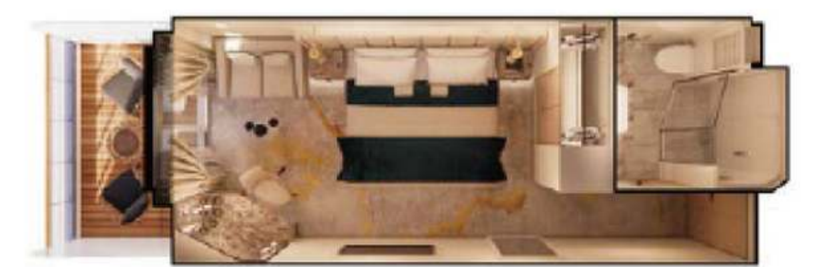
2023年ダブル・ゲストルーム・ベランダ