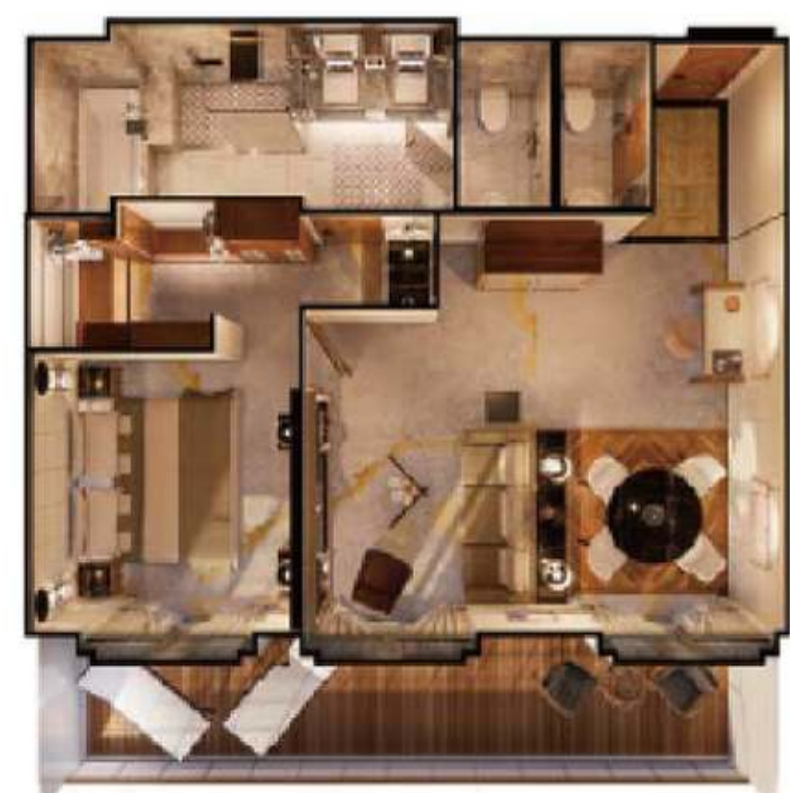
2023年ジュニア・クリスタル・ペントハウス・スイート