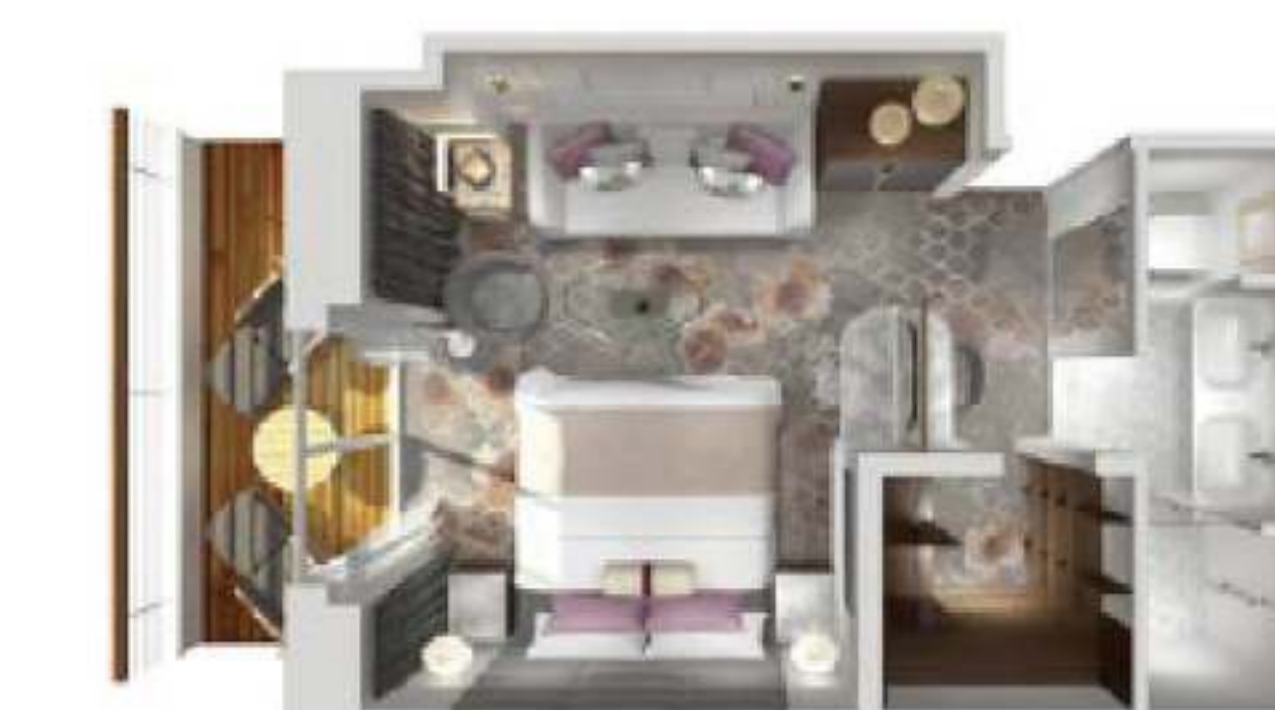
2017年アクアマリン・ベランダ・スイート