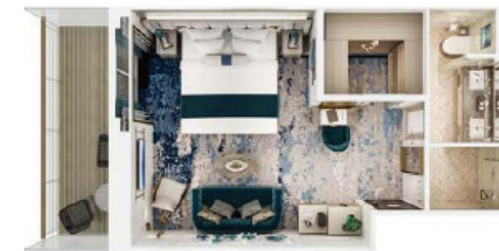
2018年アクアマリン・ベランダ・スイート