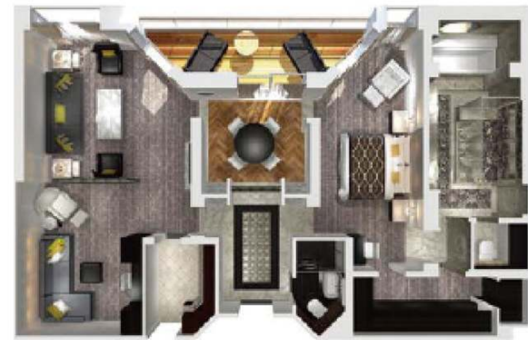
クラシック・クリスタル・ペントハウス・スイート